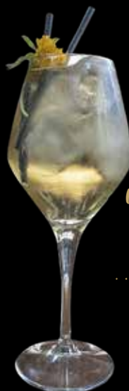
Momentum Spritz Momentum, Undurraga Demi Sec, Ginger, Syrup de maracuya.