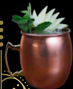
Jack Apple Mule Jack Daniel's Apple, Limón, Goma, Ginger Beer