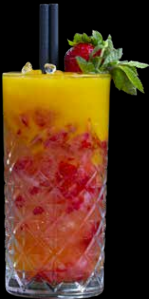
Shrup de Frutilla

Shrup de Frutilla, Jugo de mango, Nordic Ginger Ale