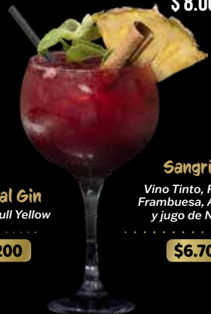
Sangría B Vino Tinto, Pulpa de Frambuesa, Arandano y jugo de Naranja