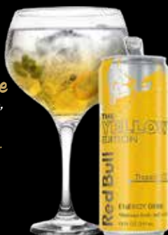
Tropical Gin Gin, Redbull Yellow